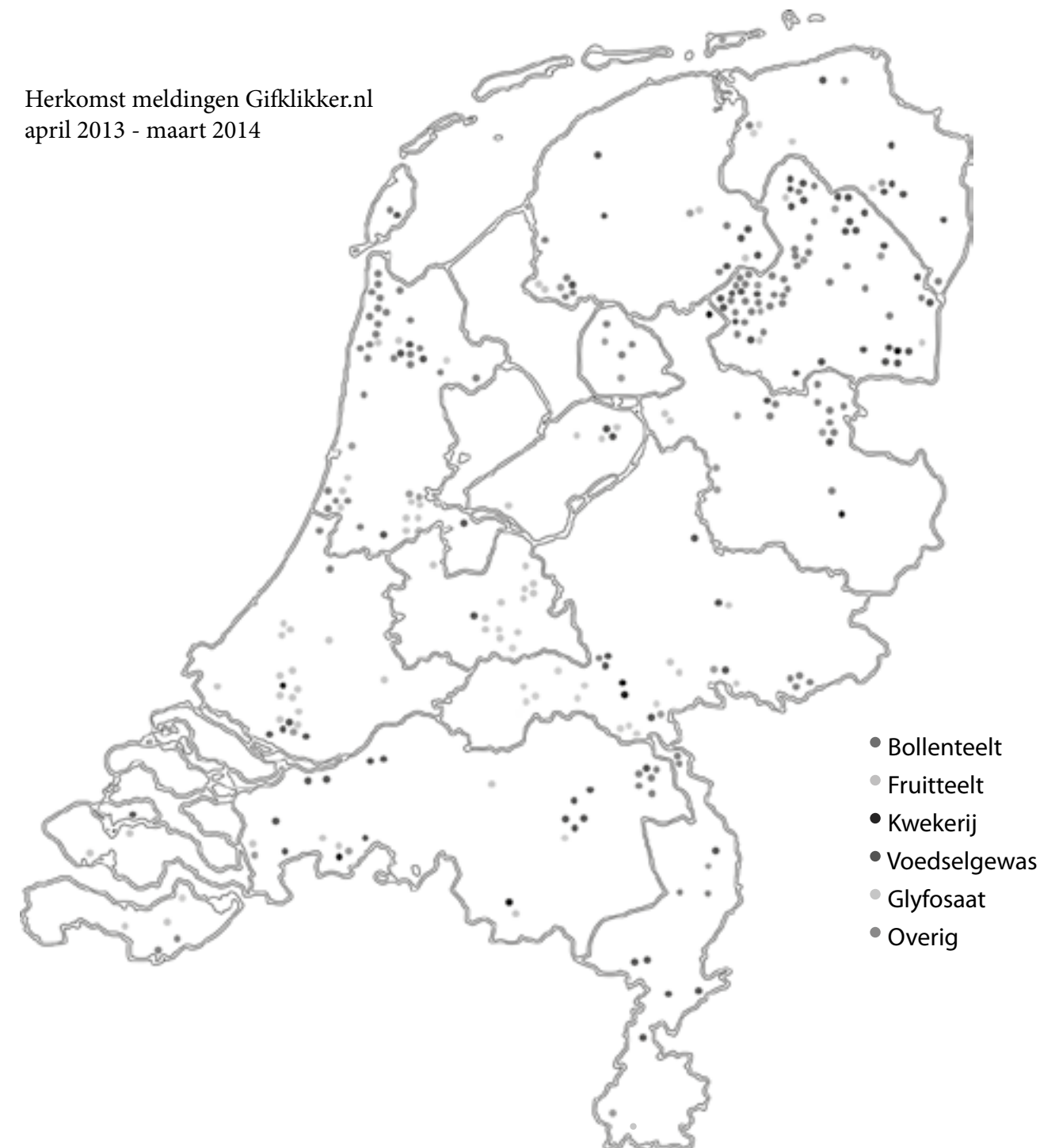
Herkomst meldingen Gifklikker.nl april 2013 - maart 2014